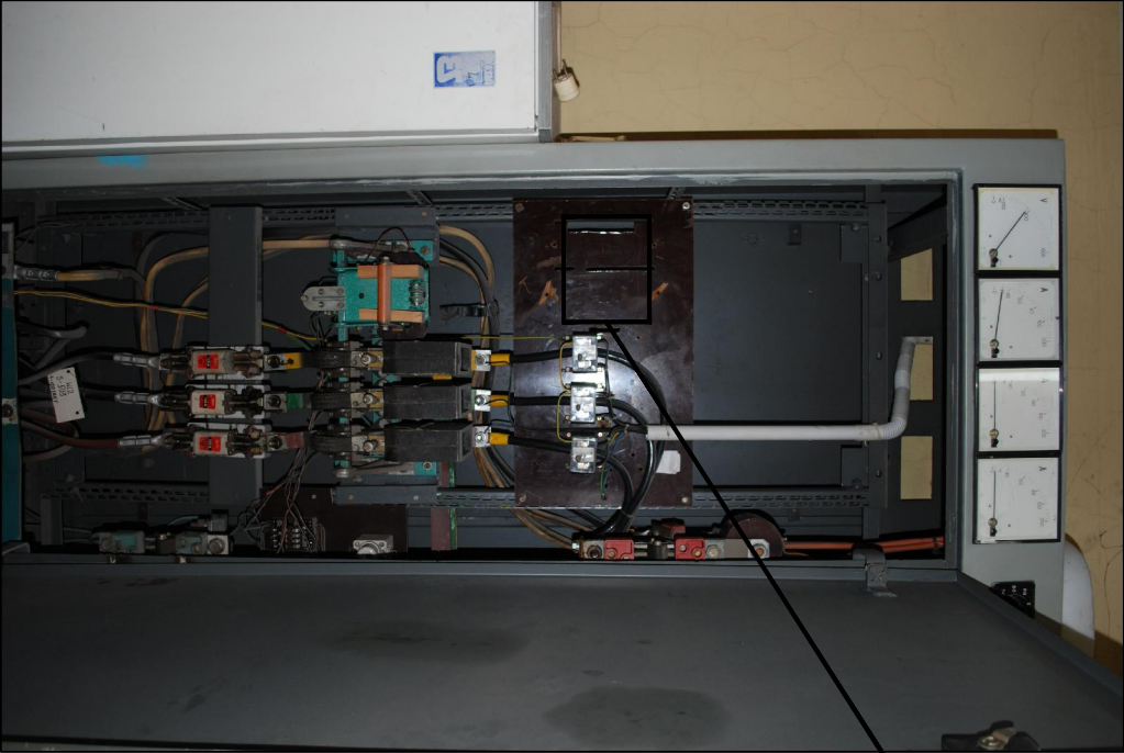
MIEJSCE MONTAŻU APARATÓW ZABEZPIECZAJĄCYCH