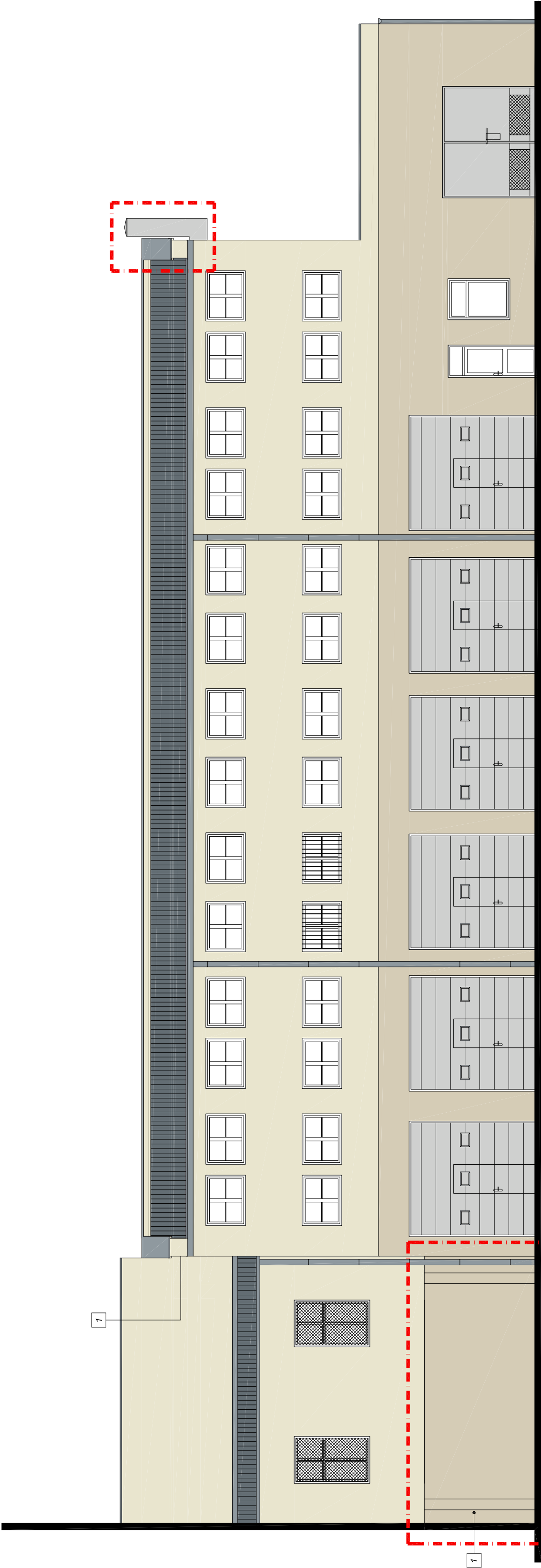
ELEWACJA WSCHODNIA SKALA 1:100