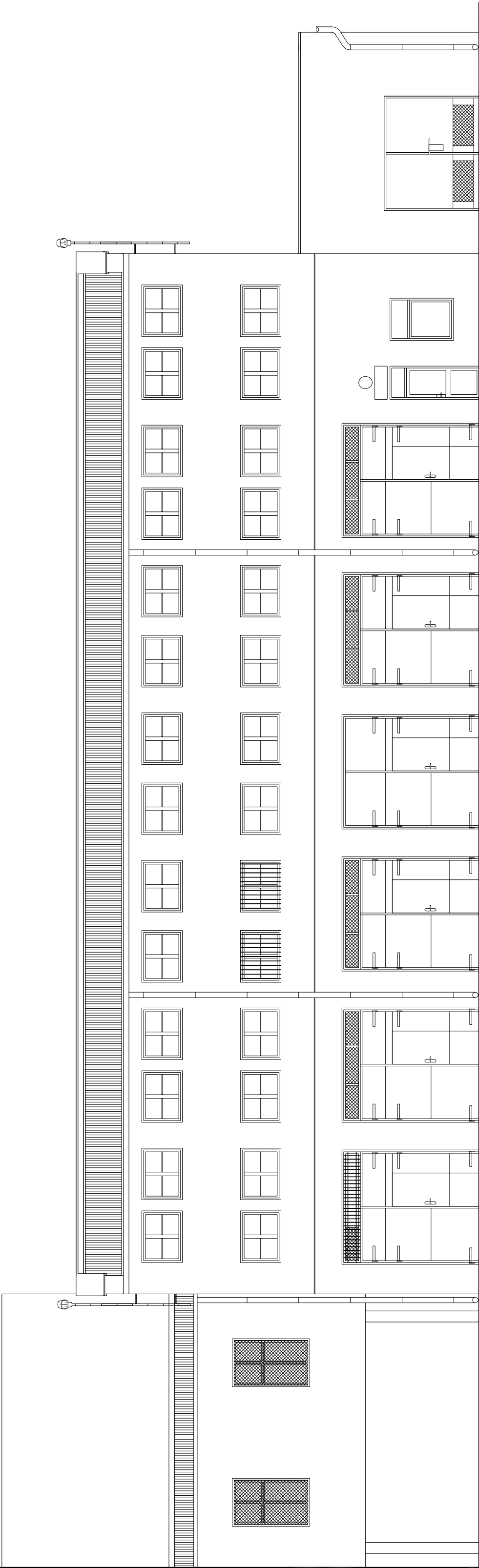
ELEWACJA WSCHODNIA SKALA 1:100