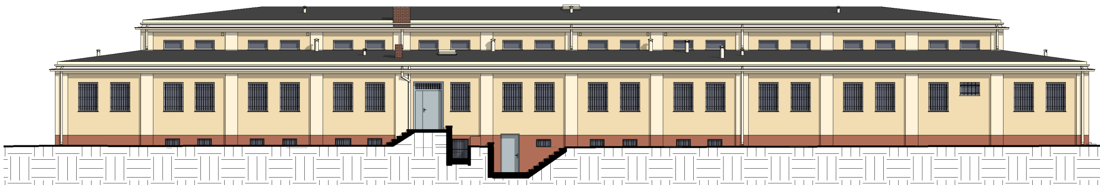
ELEWACJA WSCHODNIA 1 : 200