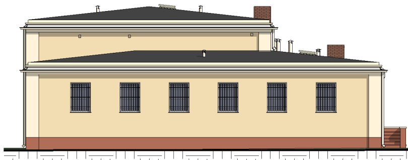
ELEWACJA POŁUDNIOWA 1 : 200