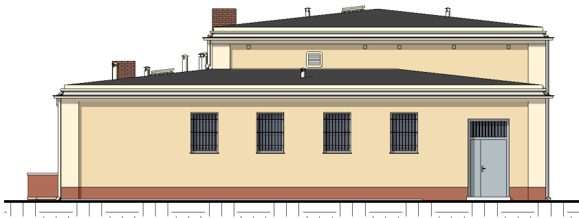
ELEWACJA PÓŁNOCNA 1 : 200