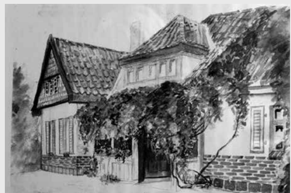
Budynek Posterunku Policji Państwowej w Starej Kiszewie, Wykonał P. Fenski 1940 – ze zbiorów D. Murglin