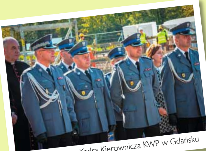
Kadra Kierownicza KWP w Gdańsku

Wmurowanie aktu erekcyjnego pod zintegrowany Komisariat Policji Gdańsk-Śródmieście, Stogi i Wodny, 2 października 2015