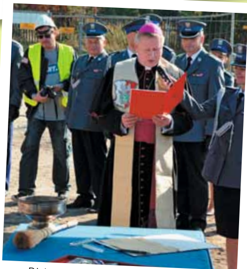
Biskup Pomocniczy Archidiecezji Gdańskiej – Wiesław Szlachetka poświęcił Akt Erekcyjny