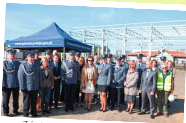
Zdjęcie uczestników wydarzenia – zostało umieszczone w pamiątkowej tubie