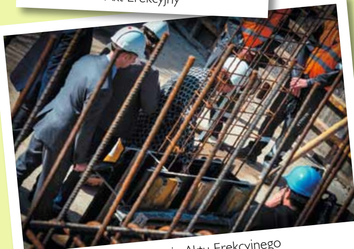
Wmurowanie Aktu Erekcyjnego