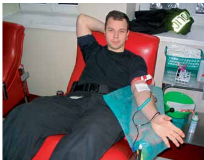
Policjant Kompanii Adaptacji Zawodowej OPP w Gdańsku