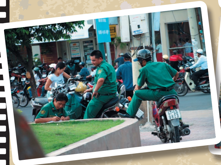
zapisy w notatniku służbowym