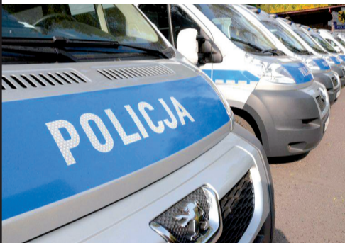
Ambulanse Pogotowia Ruchu Drogowego