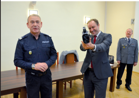
Przekazanie sprzętu przez Marszałka Województwa Pomorskiego na ręce Komendanta Wojewódzkiego Policji w Gdańsku

Dobiega końca najdroższy projekt Pomorskiej Policji współfinansowany ze środków Unii Europejskiej. Na usprawnienie systemu ratownictwa Komenda Wojewódzka Policji w Gdańsku uzyskała w 2011 r. z Regionalnego Programu Operacyjnego dla Województwa Pomorskiego na lata 2007-2013 kwotę 13 455 650 zł.