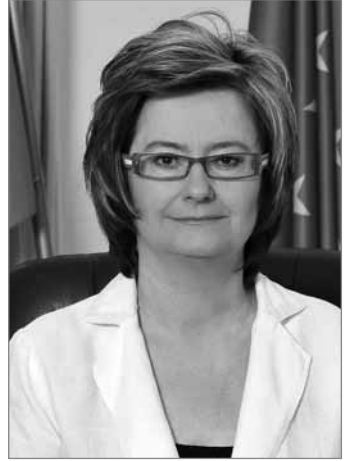
prof. Irena Lipowicz Rzecznik Praw Obywatelskich